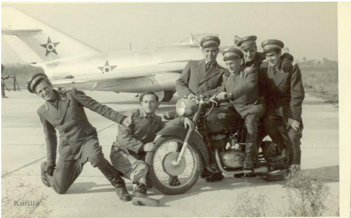
10. kép: Pózolás a „Sas” előtt, Kalocsán.