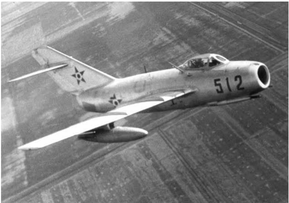
8. kép: Az 512-es oldalszámú, sugárhajtóműves MiG-15 „Sas”.