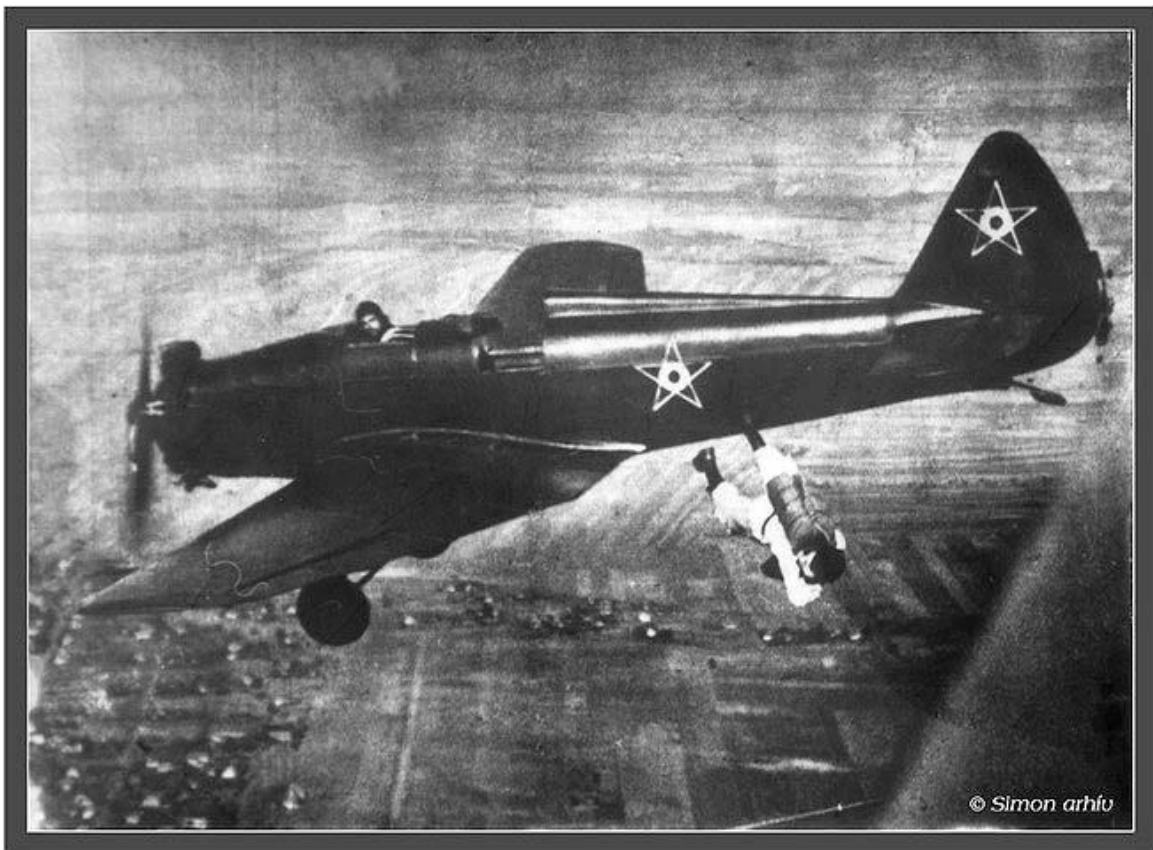
4. kép: UT-2 „Galamb” és egy ejtőernyős, a Néphadsereg 1951-től érvényben lévő felségjelzésével.