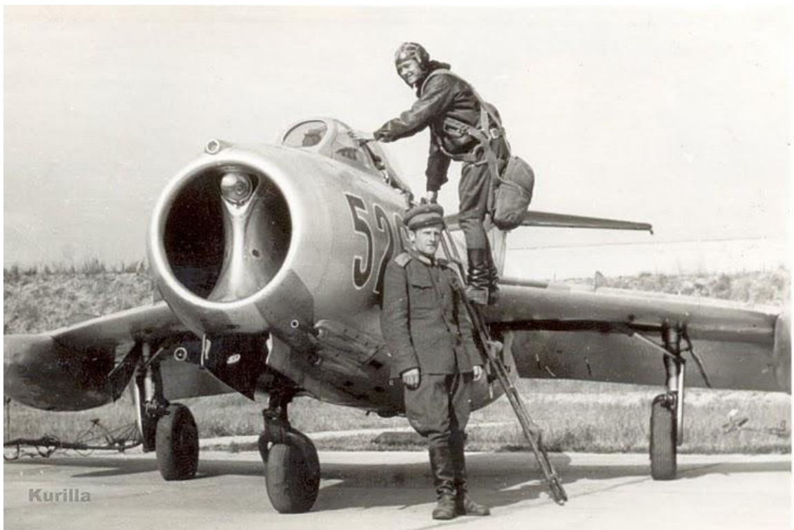
9. kép: MiG-15-ös előlről, Kalocsán.