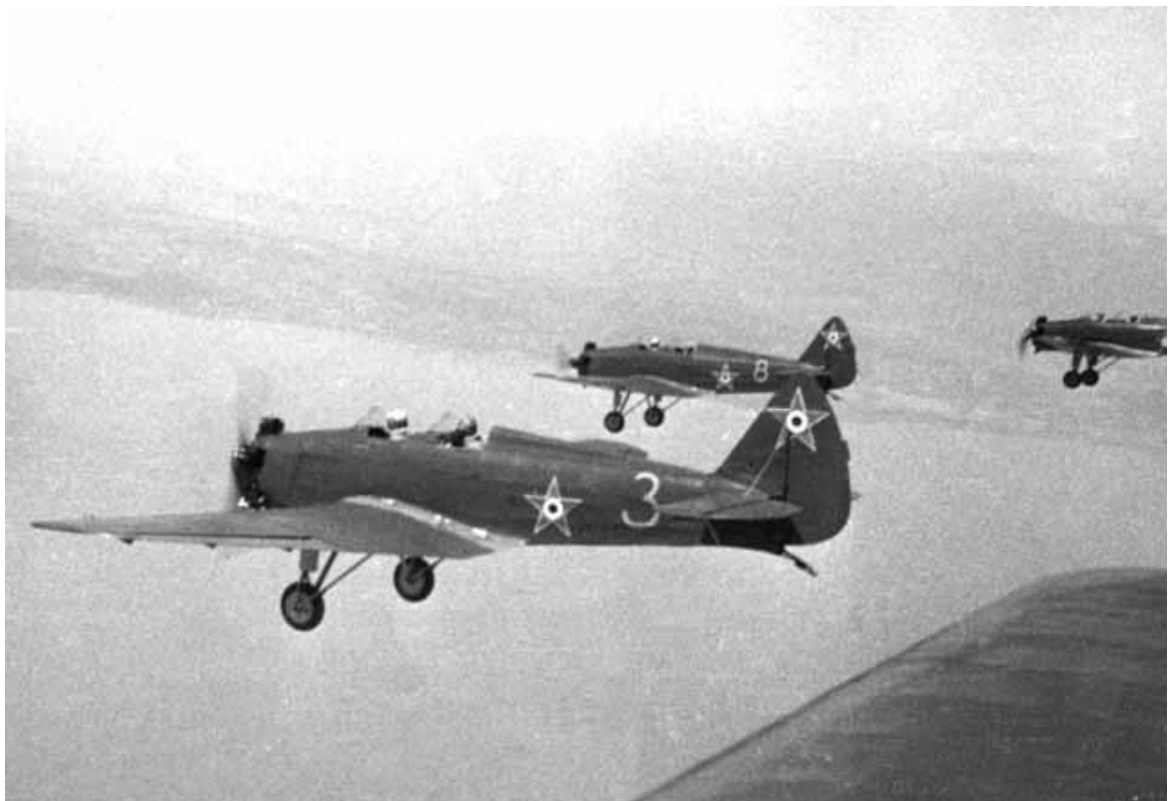
5. kép: UT-2 „Galamb” kötelék, nagy valószínűséggel a Balaton felett.