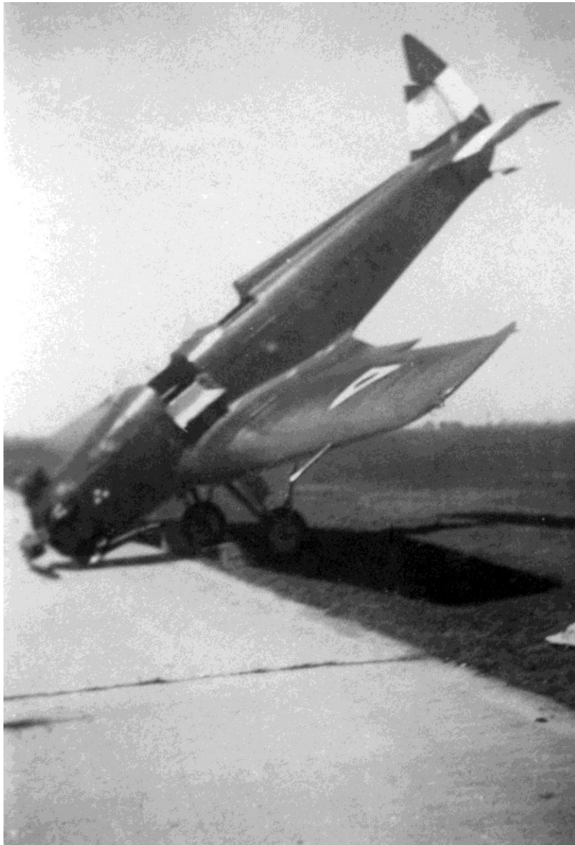
2. kép: Az I-274-es lajstromjelű UT-2 „Galamb”, repülőgépnél szokatlan „pozícióban”, 1949 nyarán. Azon ritka képek egyike, ahol az újjáalakult légierő első, a libanonival gyakorlatilag azonos felségjelzése látható.