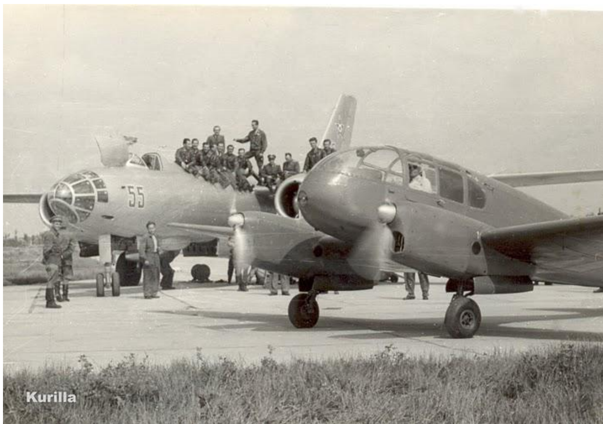
11. kép: Előtérben egy Aero-45 „Kócsag”, mögötte egy Il-28-as, a kalocsai repülőtéren.