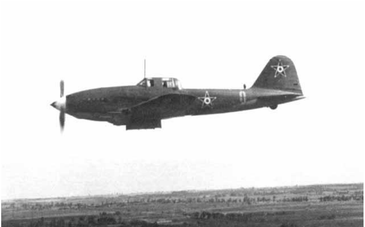
7. kép: Il-10 „Párduc” csatarepülőgép. Az oldalszáma alapján ezredparancsnoki gép lehetett.