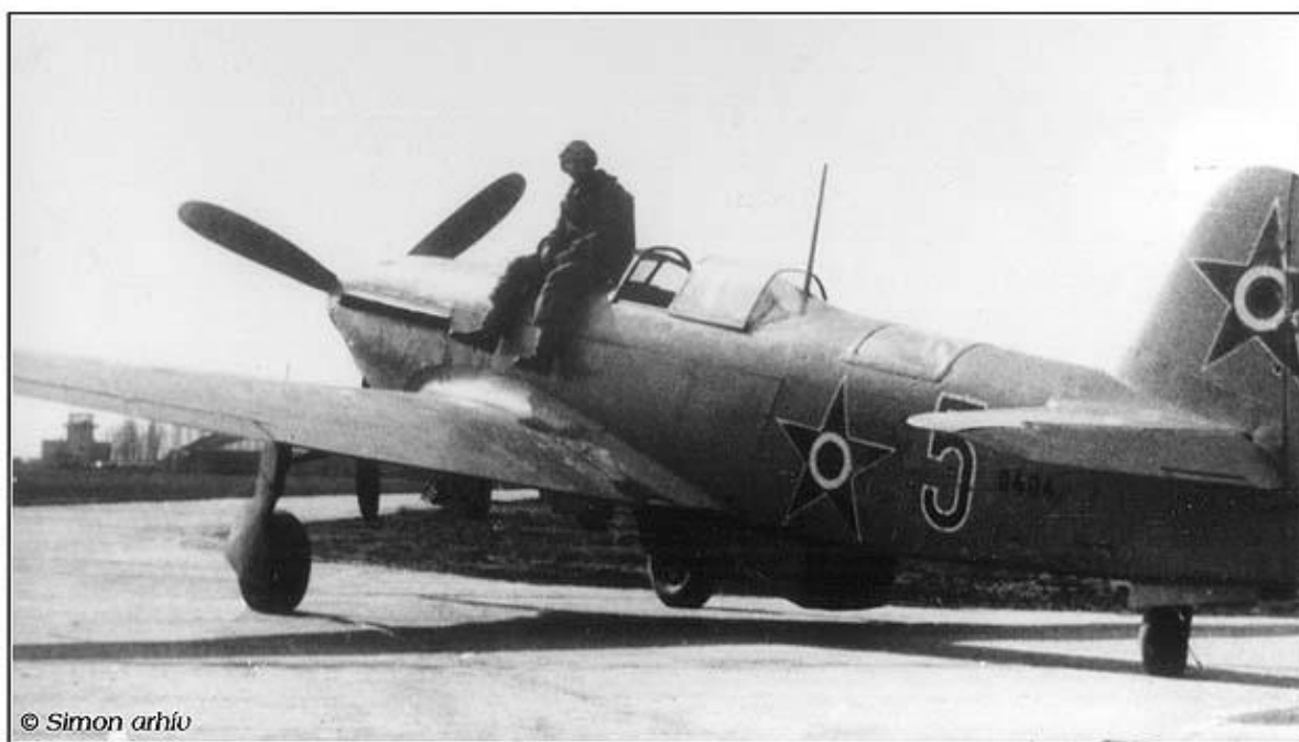
6. kép: Egyike a ritka Jak-9 „Vércse” fotóknak.